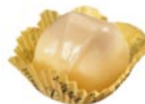
Manon sucre, 1937