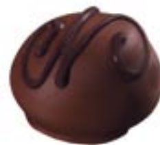
Manon lait, 1990