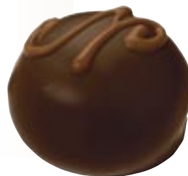
Manon noir, 1958