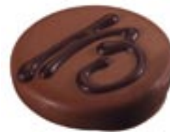
Bonbon 13, 1937