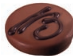
Bonbon 13, 1937