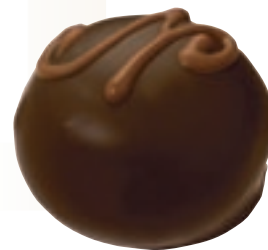
Manon noir, 1958