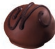
Manon lait, 1990