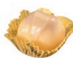
Manon sucre, 1937